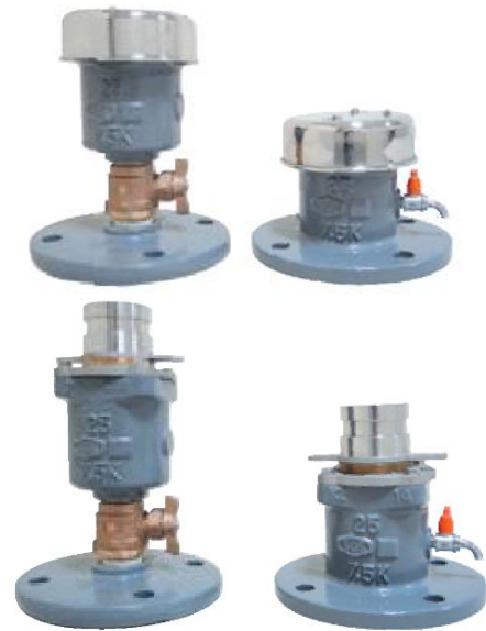
(口金付(オプション)取付状況)