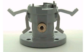
カムレバー作動状態