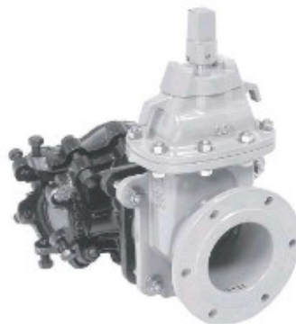
同口径ヤノT字管V型