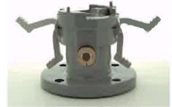
カムレバー作動状態