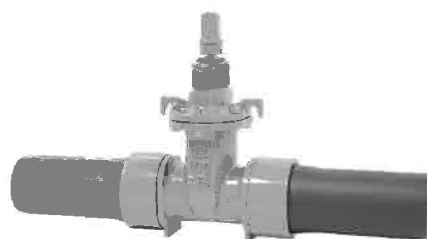
内ねじ式(EF受挿し口形) PTC B 22 単位:円