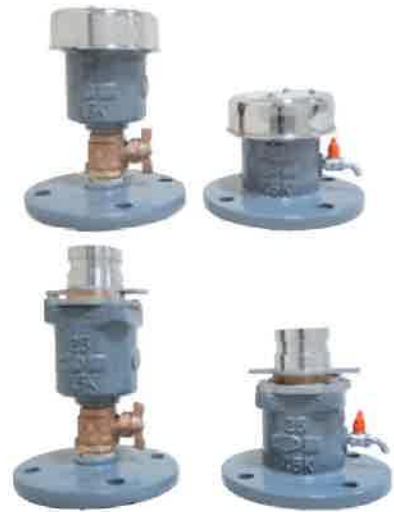
(口金付(オプション)取付状況)