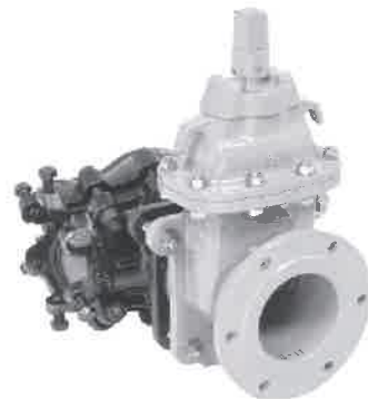
同口径ヤノT字管V型